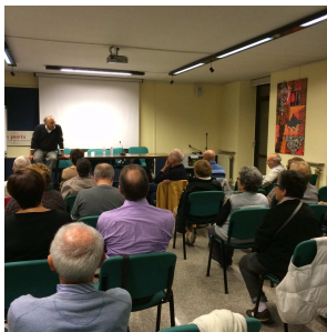
Un momento della Conferenza seguita dai presenti.

I Promessi Sposi è definito il primo grande romanzo storico italiano che racconta con estrema precisione uno spaccato della storia degli inizi del 1600 e anche nell'epilogo, dove Renzo diventa un imprenditore mentre Don Rodrigo muore in disgrazia, c'è la testimonianza dei nuovi tempi storici che stanno arrivando, la decadenza del feudalesimo parassitario e la vittoria della borghesia.